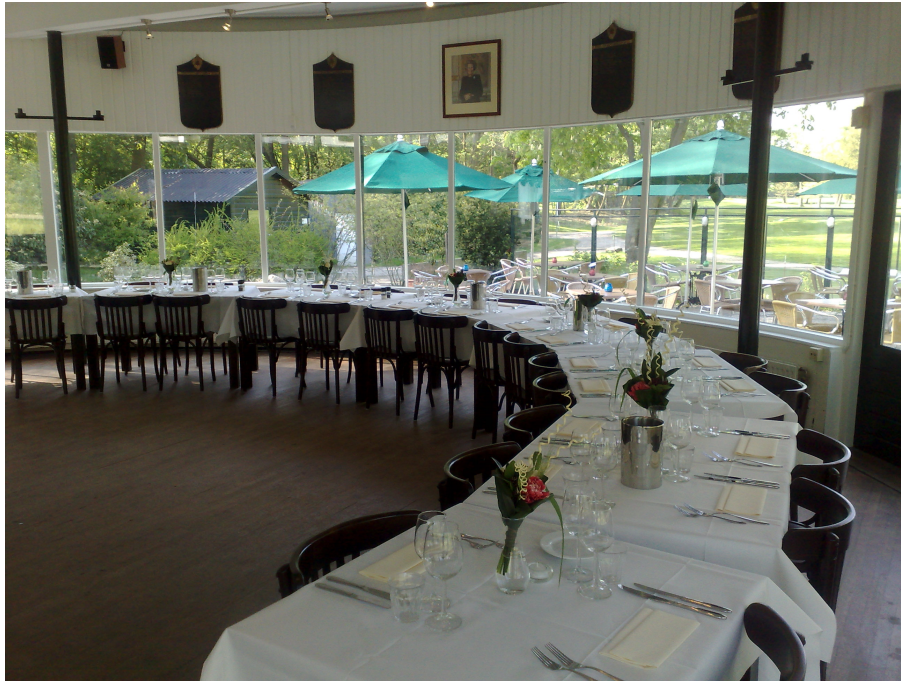
De grote zaal

In de kleine zaal kunt u recepties of borrels bespreken tot 40 personen en vergaderingen en/of diners tot 25 personen.